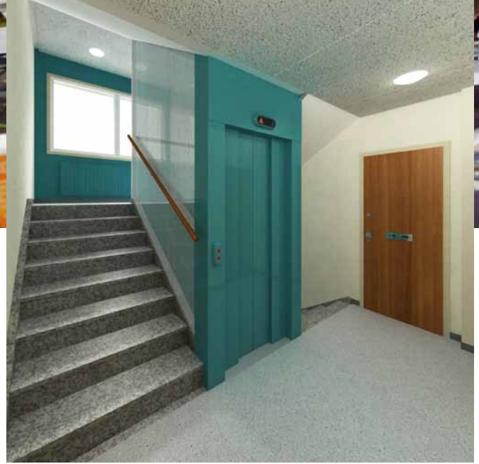
Kiinteistö Porthaninkatu 1, korjaus- ja muutostyö.