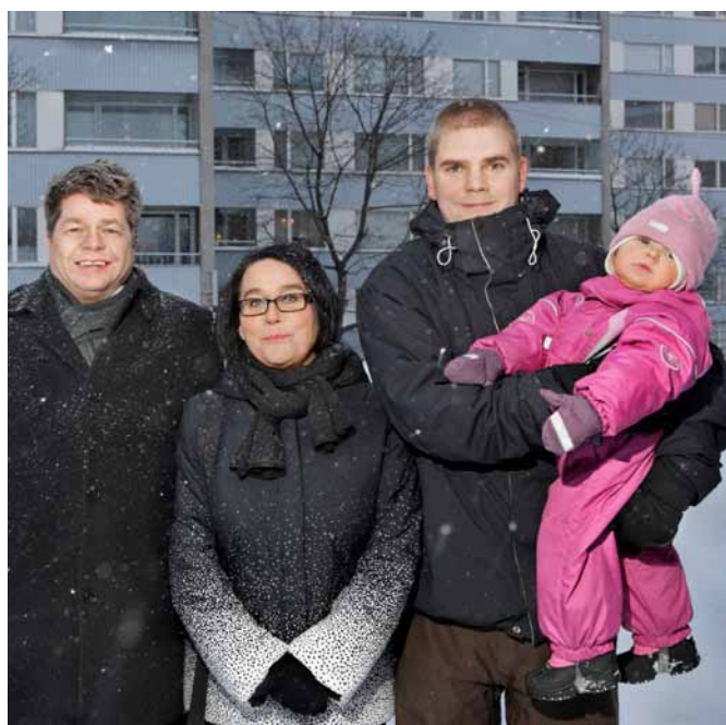
Suunnitteluvaiheissa tehdään tiivistä yhteistyötä eri sidosryhmien kanssa.