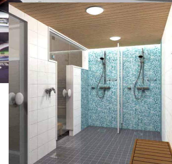
As Oy Alppilan-Ahon saunatilojen saneeraus.

Hyvään tulokseen päästään vain suunnitelmallisella työllä. FCG:n laaja-alainen osaaminen kattaa korjaussuunnitteluun liittyvät suunnittelu- ja asiantuntijapalvelut kokonaisuudessaan.