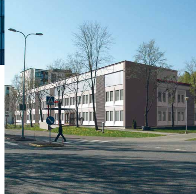
Toimistorakennuksen muutos palvelutaloksi Louhelassa, Vantaa, 2009.