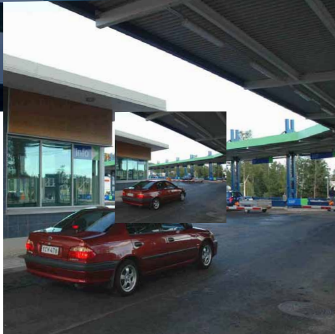
Konalan sorttiasema, HSY, Helsinki, 2005.

Vasemmalla: FCG-talo, Helsinki, 2007. Alla: Kievarin vesitorni, Tuusula, 2007.