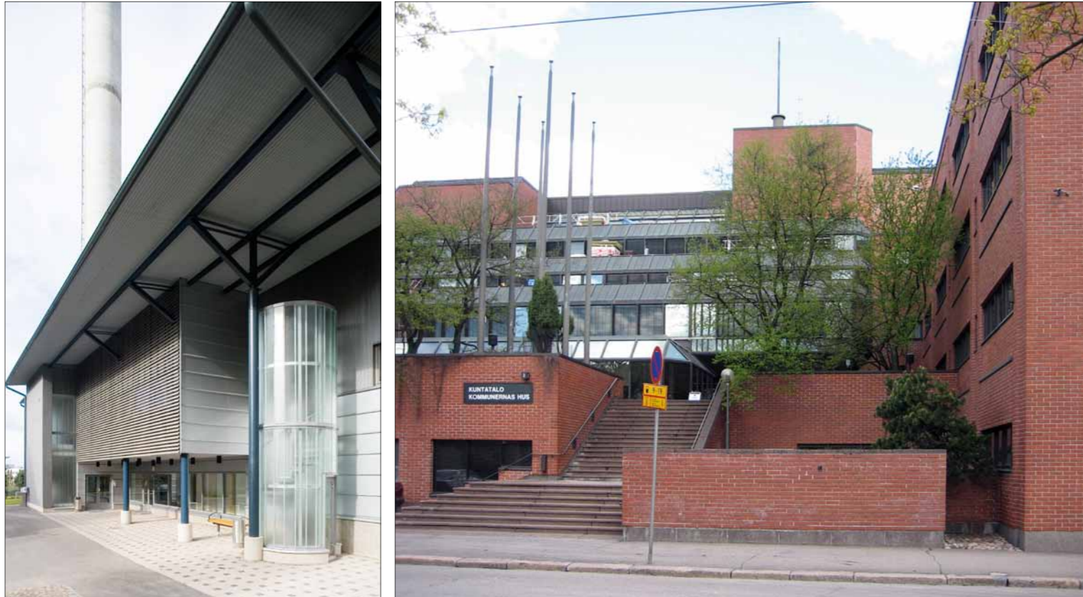
Vasemmalla: Kakolanmäen jätevedenpuhdistamo, Turun seudun Puhdistamo Oy. Hanke voitti vuoden 2009 RIL-palkinnon. Oikealla: Kuntatalo, Suomen kuntaliitto, rakennesuunnittelu 1980, muutossuunnitelmia ja rakennuttamistehtäviä vuosikymmenten ajalta.

FCG on yksi Suomen suurimmista monialaisista konsulttiyrityksistä ja markkinajohtaja monella toimialalla. Yhtiön palvelut keskittyvät infra-, rakennus-, ympäristö- ja yhdyskuntasuunnitteluun, koulutukseen ja osaamisen kehittämiseen sekä kansainväliseen kehityskonsultointiin.