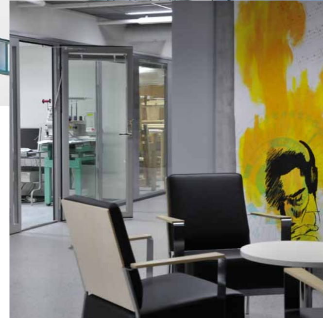
Salon seudun koulutuskuntayhtymä, Salo, 2009.