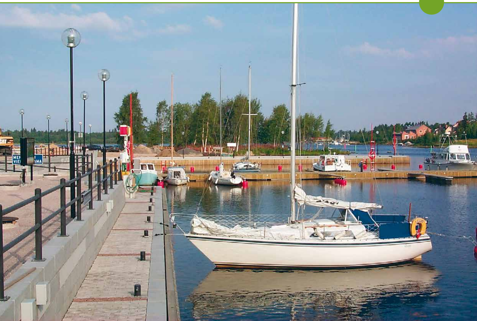
Meritullin vierassatama, Oulu.

Tarjoamme kaikille toimialoille myös rakennuttamis- ja ylläpitopalveluita. Monipuolinen asiantuntemuksemme, kokemuksemme ja osaamisemme ovat käytettävissäne!