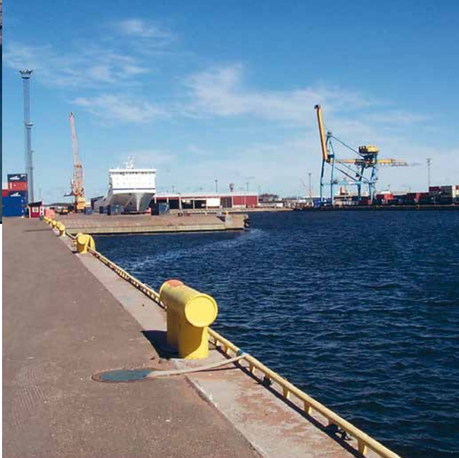
Haminan sataman laajennuksen yleissuunnitelma.