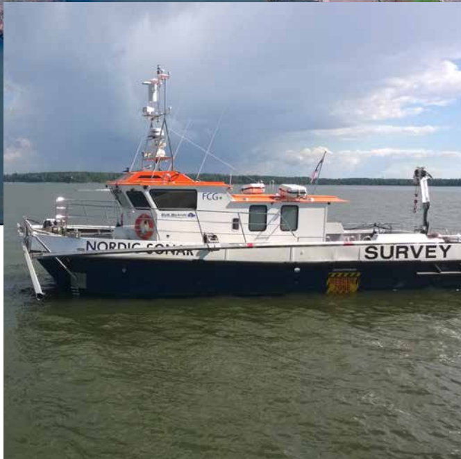
Mittaus- sekä tutkimusalus m/s Nordic Sonar.