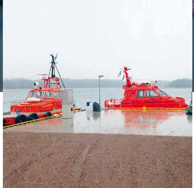
Tallbackan tielaituri, Ruotsinpyhtää.