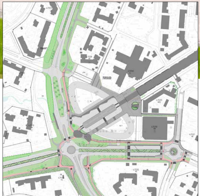
Mellunmäen keskuksen katujen suunnitelma, Helsinki