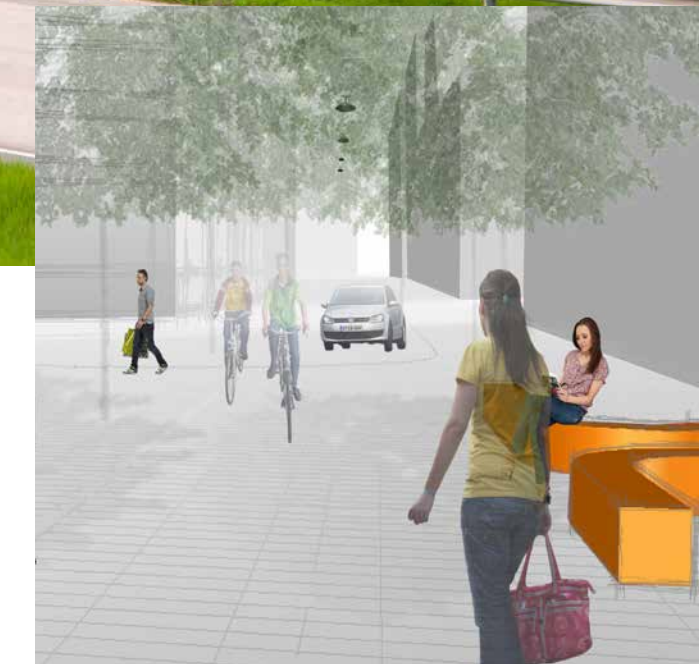
Verkkosaaren Capellanranta, Helsinki