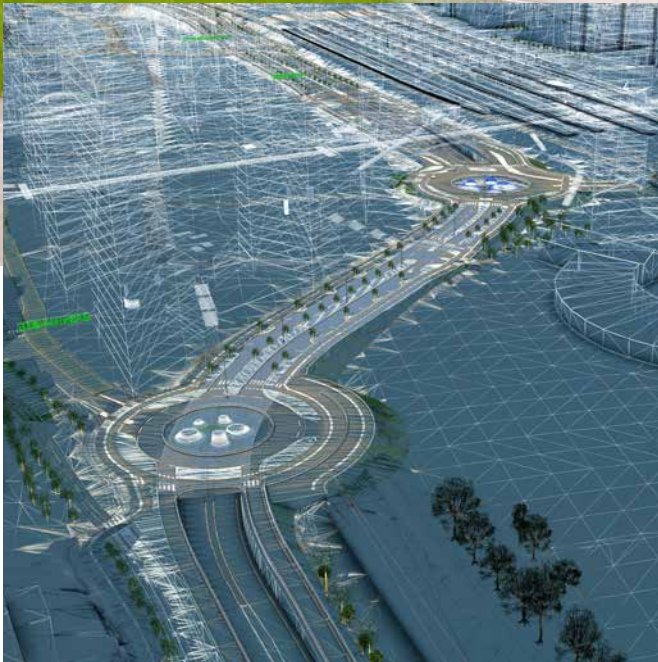
Tietomallinnus Pasilan Veturitien suunnittelualueesta, Helsinki