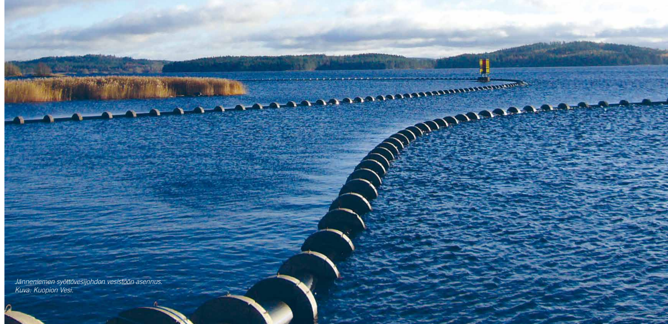
Jänneimen syöttövesijohdon vesistöön asennus.