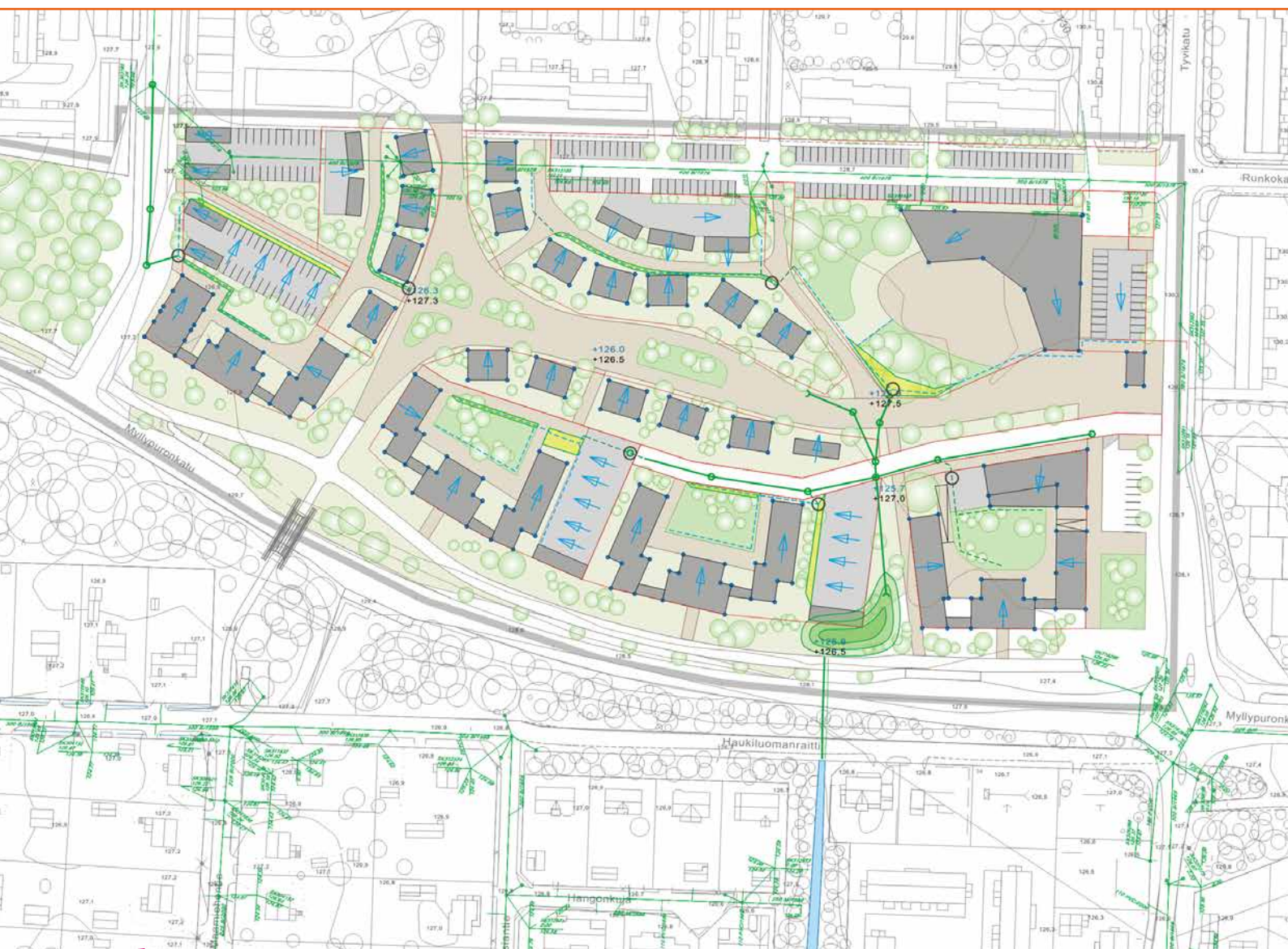
FCG:n erityisosaamista on myös hulevesien hallinnan suunnittelu. Haukiluoma, Tampere.

Monipuolinen asiantuntemuksemme, kokemuksemme ja osaamisemme ovat käytettävissänne!